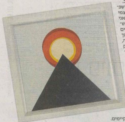
רונה שרון - פרימדיה, שוקן תעשייתי על קנזוס

היריד יתקיים בתאריכים 15-19 במאי, ימים שלישי-שבת, במתחם בית הספר העל-יסודי החדש, קריית החינוך, רח' שושנה פריסץ 3, צפון מערב תל אביב.