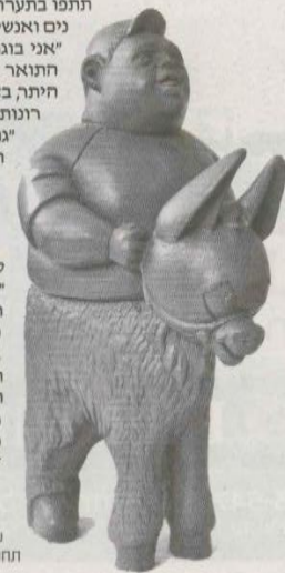
עפרה אייל גור אריה - חתופשת פסל נבס בעצ

"עבודתי עוסקת בפני השטח של החפץ והצורה במשמעות מושג ה-trompe loeil (טרומפלז'י) - ציור המרחם את העין. במעבר בין ציור לפיסול וביחס שבין מקור והעתק, המשמעות עבורי ביצירת גוף העבודות תחזו הוא בסימון המרחק בין הקיום המודרני לני לטבע. בתרבות שבה הייצוג החומרי חזק מחקול האנושי, הבלוז של נפש האדם מתגלה דרך הדברים."